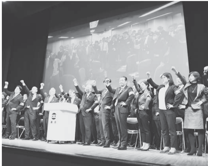
▲連合「闘争開始宣言中央総決起集会」(2月3日よみうりホール)