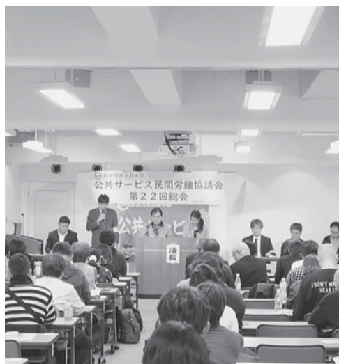
▲提案されたすべての議案が承認され、2020年度の活動をスタートした

都本部公共サービス民間協協賛(民間協)は2月15日、SKホールにて第22回定期総会を開催し、代議員33人、傍聴5人が参加した。