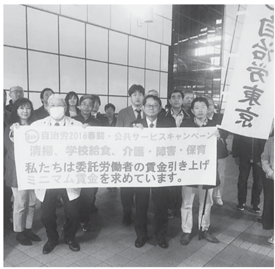
▲2018年に三多摩地協で取り組んだ街頭宣伝行動(立川駅)

東京における公共サービス民間労働者の社会的横断的ミニマム賃金(月額)を、20歳18万円、30歳22万円、40歳26万円、50歳30万円とし、この金額を基本に、一時金年間2ヶ月、退職金相当分として1ヶ月分