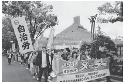
▲昨年度のメーデーの様子