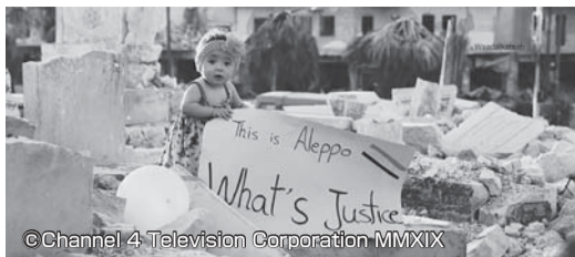
●2020年2月29日よりシアター・イメージフォーラムほか全国順次ロードショー 電話：03-5766-0114