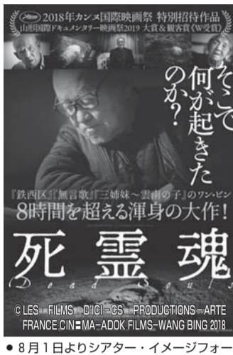
2018年カンヌ国際映画祭 特別招待作品 『鉄西区「無言歌」「三姉妹〜雲南の子』のワン・ピン 8時間を超える渾身の大作! ● 8月1日よりシアター・イメージフォーラム(03-5766-0114)ほか全国順次公開

1950年代後半に起きた中国共産党の反右派闘争で粛清され、ゴビ砂漠の夾辺溝にある再教育収容所へ送られた人々。ぎりぎりの食料しか与えられず、過酷な労働を強いられ、劣悪な環境で多くの人が餓死し、「百家争鳴」キャンペーンを信じ自由に発言したら 「右派」と呼ばれ、55万人もの人々が収容所に送られたと言われている。王兵監督は『鳳鳴フォンミン』中国の記憶(2007)、『無言歌』(2010)でも反右派闘争を追いつつ、いまだに明らかにされていない中国史の闇を追求している。 大飢饉が重なり収容所は地獄になった。生還率10%ともいわれた収容所を生き延びた人々。その後、開拓地として頒けられたその地で暮らす農民たち。 2005年から2017年までに撮影された120人の証言、600時間及ぶ映像から本作はまとめられた。8時間以上に渡る作品だが、収容所の背景や状況を提示する第1部。衝撃的な収容所の飢餓状況の第2部。収容所の係員だった人の証言もある第3部と分かれている。 厳しい体験をした人たちの言葉はずしりと重く苦しい。多くの亡くなった人たちの状況、棺桶がなくなつた後は布団に丸めて遺体を放置した話などは涙が出た。壮絶な話の数々に気が引きしまる思いで観た。