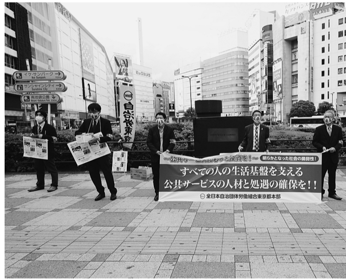
▲池袋駅東口での街頭宣伝の様子(4/16)

保、コロナ禍に限らない重要性和存在価値を社会一般にさらに浸透させる「公共サービスにもつと投資を！」キャンペーンの全国展開を2021春闘方針で確立した。 都本部は自治労方針を受け3月25日から4月20日までの間、「公共サービスにもつと投資を！」をスローガンに、都本部組織内議員