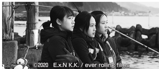
●2021年5月1日より ポレポレ東中野ほか全国順次公開 (TEL: 03-3371-0088)