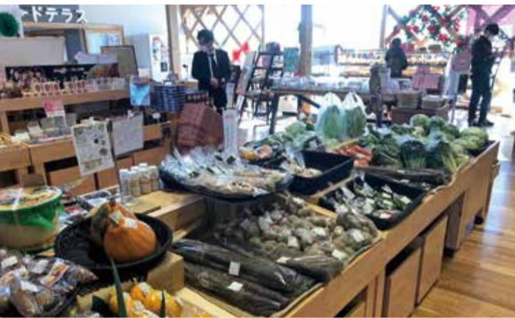
▲浪江町「道の駅みなみ」にて世界一厳しいとも言われる検査基準をクリアした福島県産品が並ぶ