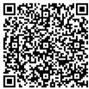
じちろうマイカー共済掛金試算