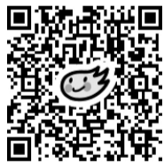
団体生命共済掛金試算

じちろう共済の各種手続きや加入のご相談、お見積り内容の確認、既に参加している共済の内容のご確認、こういったプランが良い？など、気になることがありましたら各組合にお気軽にご相談ください。