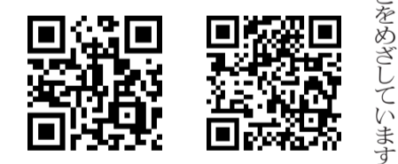
▲QR エファジャパン紹介動画(左) ▲QR エファパートナー特設サイト(右)