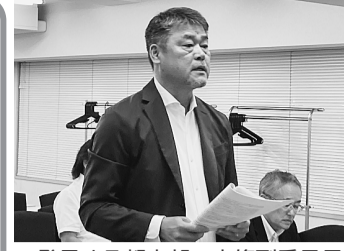
▲発言する都本部 中條副委員長