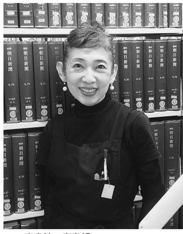
●出身地：東京都 ●組合歴 2019年4月～執行委員長 2024年4月～執行委員長(再)

司書なので、本の紹介をすることを思われるだろうから、その期待には応えたい。その前に、一つ。2020年4月会計年度任用職員制度が施行されたが、4回の「更新」を経て、私達組合