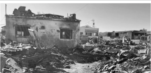
▲輪島市の様子。建物の再建には程遠い状況だ。