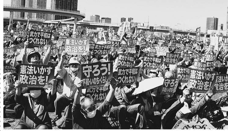
▲集会参加者全員でアピールカードを掲げてシュプレヒコールを上げた。

5月3日、東京臨海広域防災公園にて「武力で平和はつukれない！とりもどそう憲法いかにす政治を」2024 第10回憲法大集会が開催され、約32,000人が参加した。