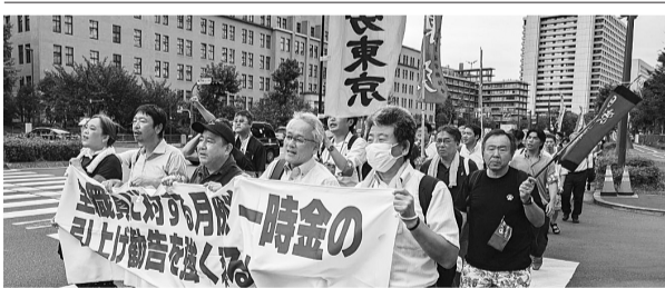
▲人勧期中央行動におけるデモ行動の様子

告となるよう取り組みを強化していく必要がある。人事院は、社会と公務の変化に応じた給与制度の整備と称して、本年の勧告において必要な措置を講ずるとしている。具体的な項目としては「地域手当の大括り化」や「扶養手当の見直し」等が上げられる。特に地域手当は、民間の賃金水準を基礎とし、物価等を考慮して定める地域に在勤する職員に支給される手当であり、国において2006年に導入されるとともに、地方においても地方自治法の改正により調整手当から地域手当とされた。地域手当は国が自治体ごとに支給率を定め、国基準を超える率を設定した場合は特別交付税の減額ペナルティが課せられる。現在では0.20%で各自治体に基準が設けられており、全国的には約75%が不支給、都内自治体においても賃金格差が生じている。今回の大括り化では都道府県単位を基本に検討が進められている。また、扶養手当については配偶者手当を廃止し、子の手当配分増が検討されている。