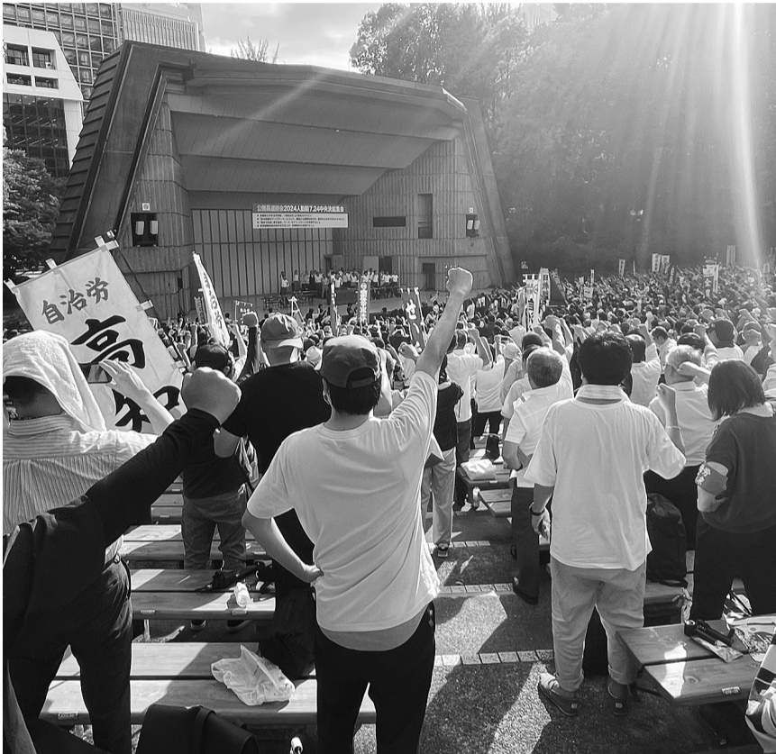
▲公務員連絡会2024人勧期7.24中央決起集会の様子(日比谷公園大音楽堂)

連合の2024春季生活闘争の最終回答集計によると、定期昇給とベースアップ分を合わせた賃上げ幅は加重平均で15.281円(5.10%)となり、最終集計まで5%超えを維持したのが1991年以来33年ぶりだ。一方で、消費者物価指数は高止まりしている。このように厳しい生活実態を踏まえ、全職員の月例給・一時金の引上げにむけた勧