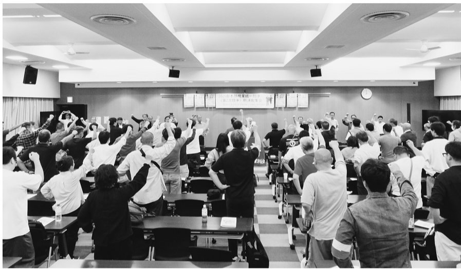
▲2025都本部現業統一闘争(第2次闘争)総決起集会の様子(2025年10月7日・自治労会館ホール)

そして、働く現場にいる私たちも、当局も、ともに求めるのは質の高い持続的な公共サービスの提供だ。あたりまえの生活を支え、住民にむき合うことができ