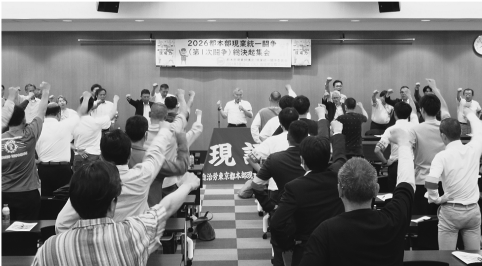
▲2026都本部現業統一闘争(第1次闘争)総決起集会の様子