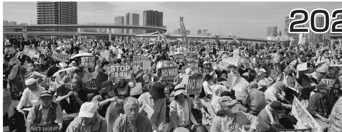
▲「憲法いかにして平和な世界を」などが書かれたプラカードを掲げる参加者

今年も「改憲発議を許さず、憲法をいかにし、平和・いのち・人権を守る」、「平和主義をつらぬき、核兵器のない世界をめざす」などのスローガンを掲げ、2026憲法大集会が5月3日13時より東京臨海広域防災公園で開催され、全体で50,000人、都本部から279人が参加した。