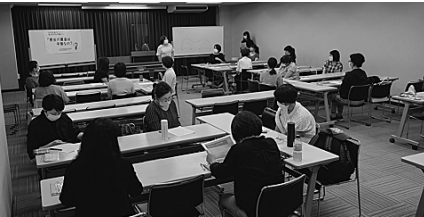
▲第2回女性労働カフェ(9/30)の様子。参加者同士の自由な話し合いが行われた。

の三木事務局長が現状と課題を伝えた。後半は3〜5名程度に分かれ、テーマに関することや、職場の課題などを自由に話し合った。「交渉に出て言葉がわからない」などの「組合がある」に共感したり、人員不足など共通の課題に気づき、職制や職種を越えたつながりができた。